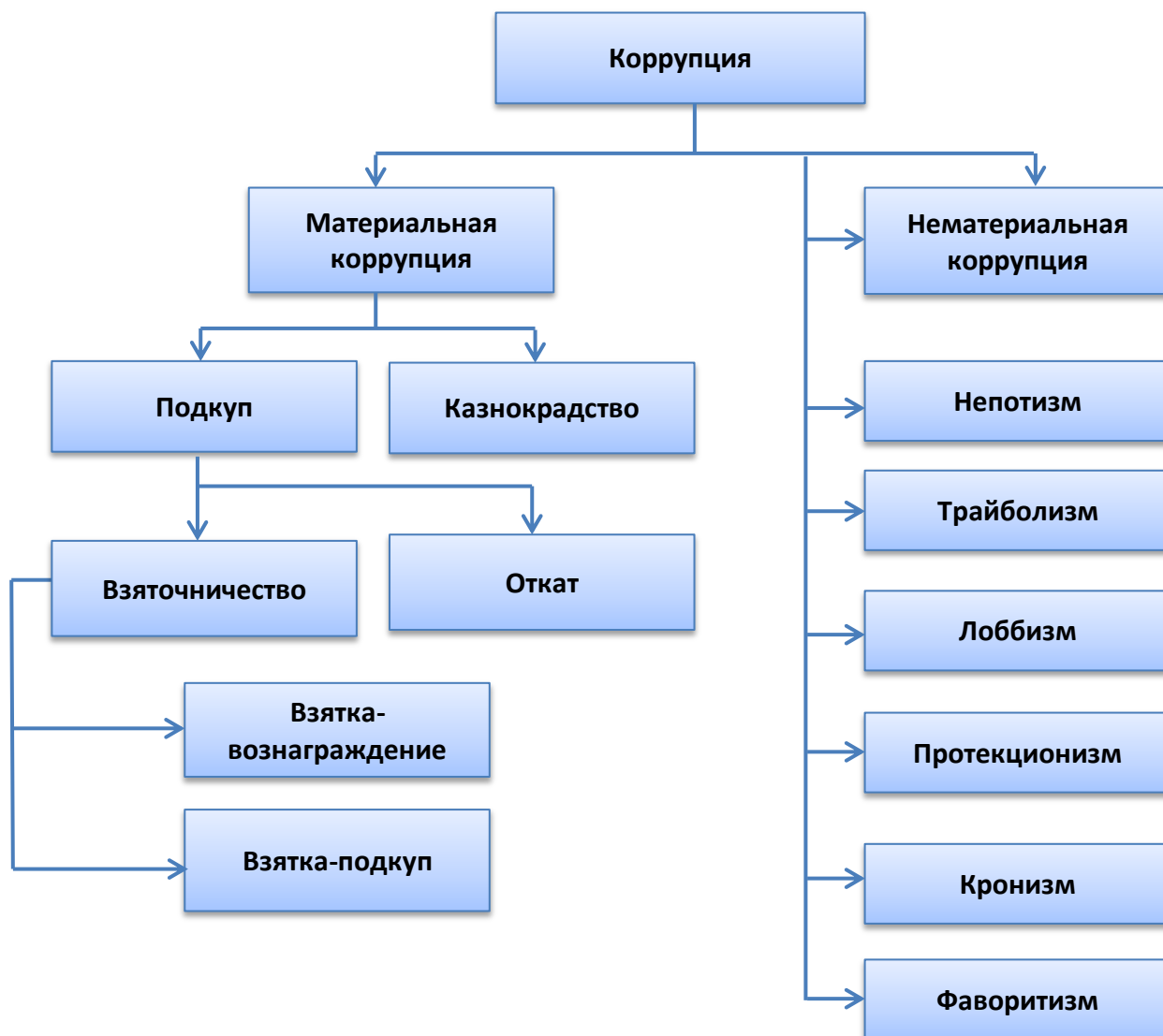
Рис. Классификация коррупционного поведения по мотивам [45, с. 13].

Кроме того, исходя из мотивов, лежащих в основе тех или иных коррупционных деяний, коррупцию в научной литературе делят на материальную и нематериальную, которые, в свою очередь, подразделяются на конкретные виды коррупционного поведения (рисунок).